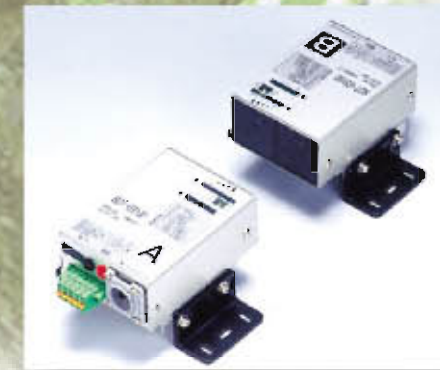
空间光传送装置(无电缆传输方式) 监视图像无线传送装置