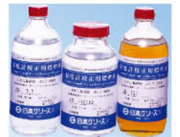
粘度计校正用标准液