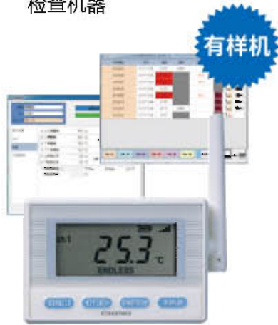
IOT温湿度无线监控系统