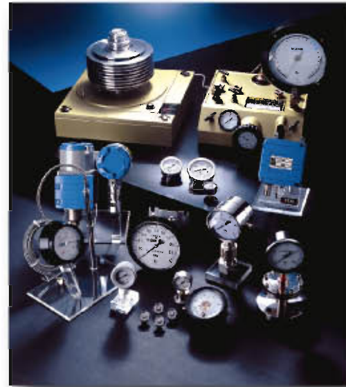
各种压力表，在线仪表