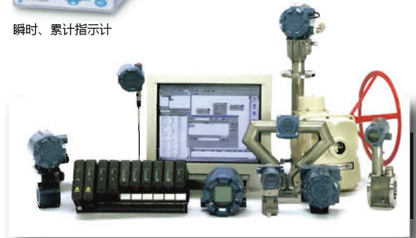
各种流量·在线仪表