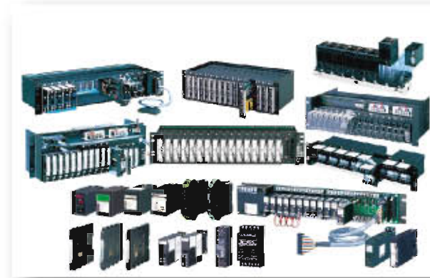
避雷器、信号变换器