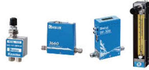
流量控制器、微小流量计

压力表、压力传感器 温度表，周边机器 放射温度热画像装置 各种流量计 各种液位计 各种传感器