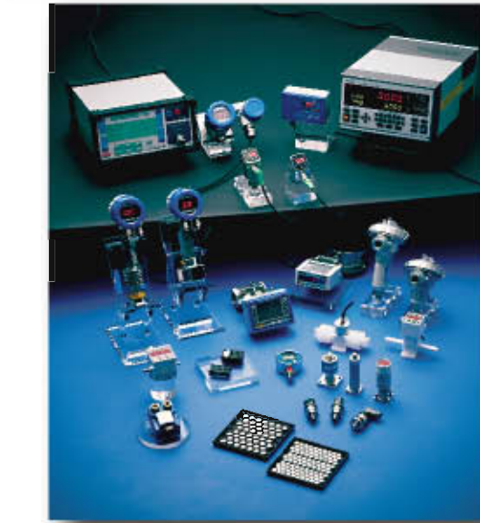
压力传感器，压力发生器