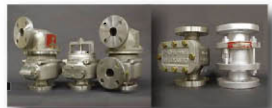
呼吸阀·火焰阻燃器