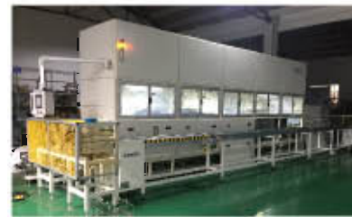
超声波去毛刺设备