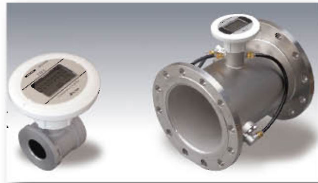
超声波气体用流量计