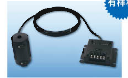
高感度油雾检测仪