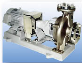
西垣泵制造(株)螺旋泵