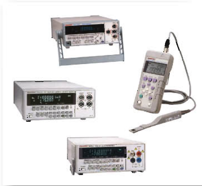
计测电源·数字万用表·光功率计